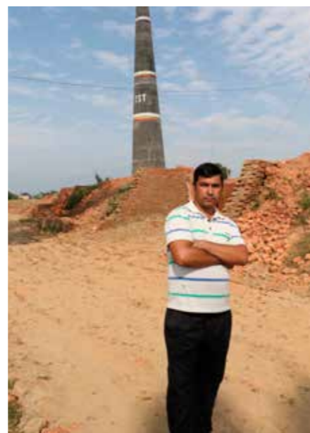
Vi har ingen barn som er tilsatte her, men de jobber gjerne med foreldrene sine, sier fabrikkseieren.

EN GJELDSSIRKEL. Å arbeide med murstein er tungt og helsefarlig. De som arbeider her er fattige sesongarbeidere, og arbeidet krever ingen spesiell utdanning. De fleste barna her går ikke på skole. Ifølge nettstedet «Slavery in Nepal» arbeider flere av dem sammen med sine foreldre. Flere av de voksne arbeider her fordi de har fått utbetalt penger på forskudd og bruker sesongen til å