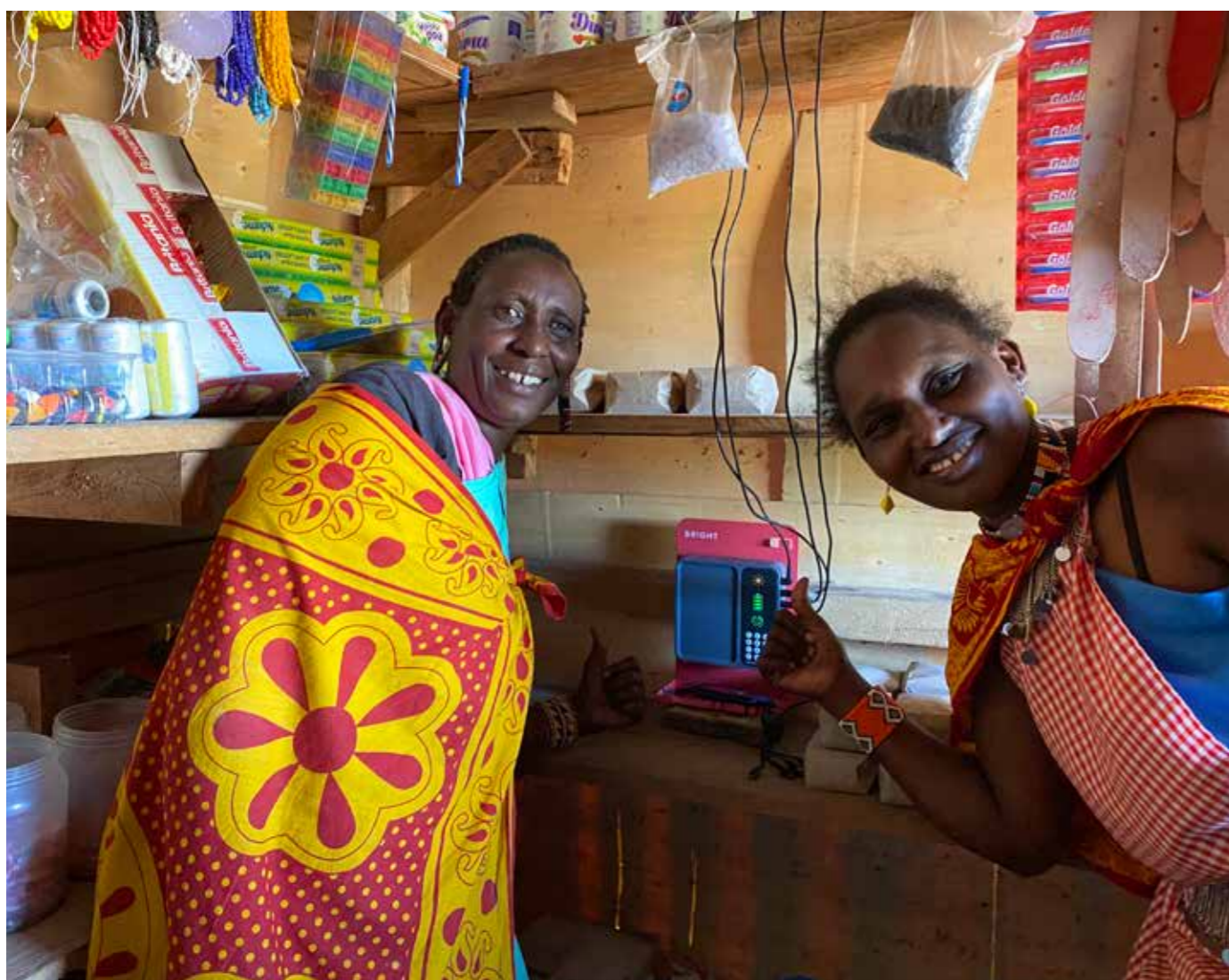
Butikken min, det at jeg kan være agent og selge miljøvennlige og bærekraftige produkter som solcelle og de miljøvennlige ovnene, betyr mye for oss, sier Soit som her har vist et solenergianlegg til en mulig kunde.

TEKST OG FOTO BARBRA NAYIGA SEBUYIIRA, OLESERE, MASAI MARA, KENYA