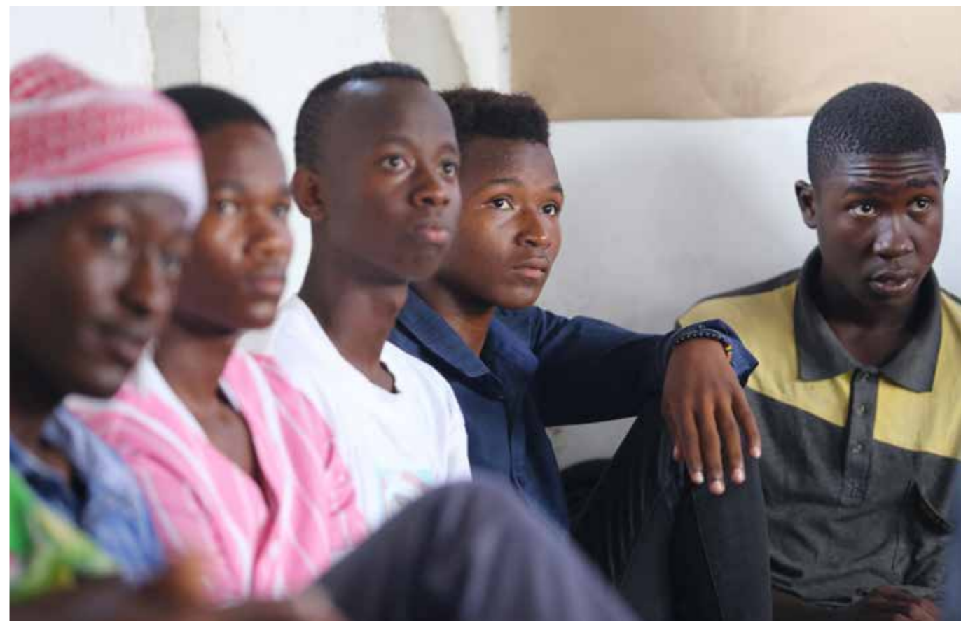
Arbeidsløysa aukar i svært mange av landa me arbeider i og Covid 19 sender millionar ut i ekstrem fattigdom.

” Borna sluttar på skulen, og barneekteskap, barnarbeid og trafficking er nokre av dei triste fylgjene for borna når mor og far sin inntekt blir borte.