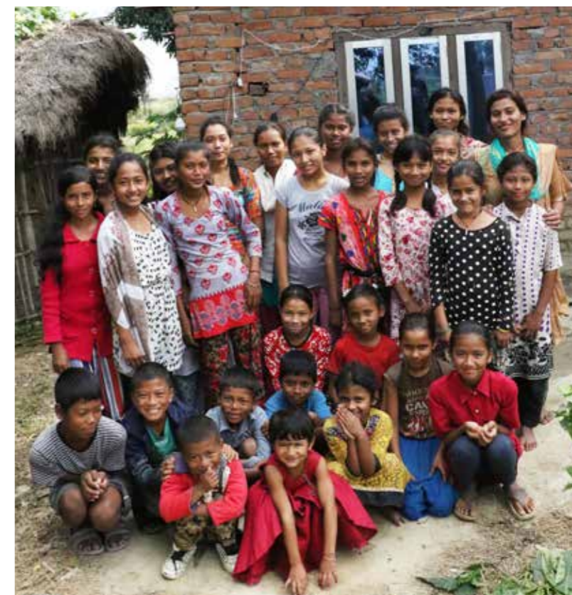
Livsmestringskurset Samvad er viktig for jentene i denne landsbyen. Her er noen av ungdommene og barna som har glede av Samvad og samarbeidet organisasjonen SSDC har med Strømmestiftelsen.

– Samvad utvikler oss, og vi lærer nye ting om barneekteskap, om medgift, barnearbeid, handicap og mye annet. Dette er ting vi ikke kunne noe om fra før, men som vi nå vet en hel masse om, sier de tre jentene. – Flere av barna våre har få år på skolen. Derfor er det de lærer på Samvad fint, sier en mor. Datteren hennes er 12 år gammel. Når det er sesong, må også hun gå til elva der hun knuser stein og bærer sand. Selv er hun dagarbeider og arbeider nå i rismarkene. – Det er trist at det skal være slik. Det er trist at vi ikke kan få utdanning, at vi kan studere og bli noe. Hver dag ser vi vennene våre på vei til skolen. Jeg begynner nesten å gråte når jeg tenker på at det kan ikke jeg. Ryggen, beina, knærne og det harde arbeidet ødelegger helsa vår. For vi må arbeide og betale gjelda vår og tjene til livets opphold. Dessverre, men slik er det, sier de tre tenåringene.